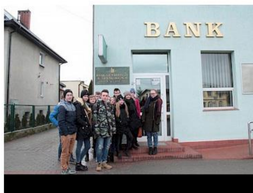
Wizyta w banku