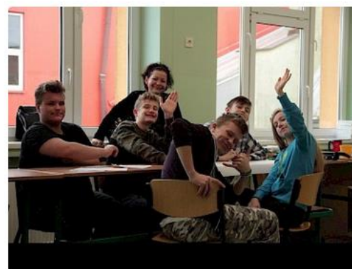
Plany na przyszłość

Ferie z ekonomią to zajęcia realizowane w gimnazjach Edutainment – nauka przez zabawę