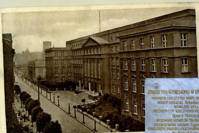
KRÓLEWSKA HUTA. Zakład Ubezpieczeń Społecznych (na ul. Dąbrowskiego).

Budynek Zakładu Ubezpieczeń Społecznych w Królewskiej Hucie (Chorzowie), lata 30. Biblioteka Śląska w Katowicach