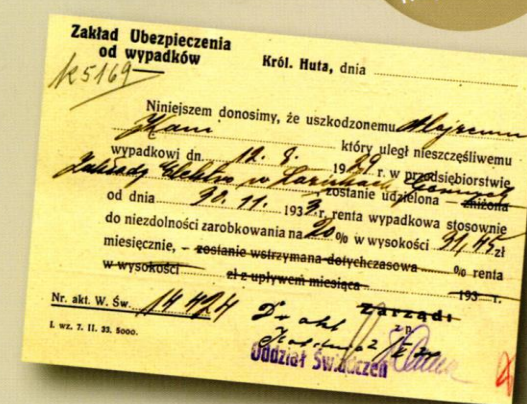
Zaświadczenie o przyznaniu renty wypadkowej. Królewska Huta 1933.