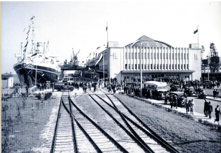
Port Gdynia (do II wojny światowej jeden z najnowocześniejszych portów morskich w Europie, który miał znaczący wpływ na rozwój polskiej gospodarki), 1935. Na zdjęciu widoczny transatlantyk „Piłsudski”.