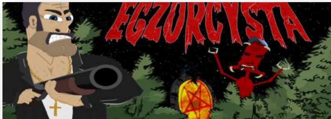
Egzorcysta Reżyseria: Bartosz Walaszek