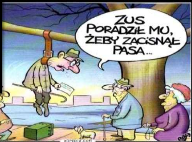
ZUS poradził mu