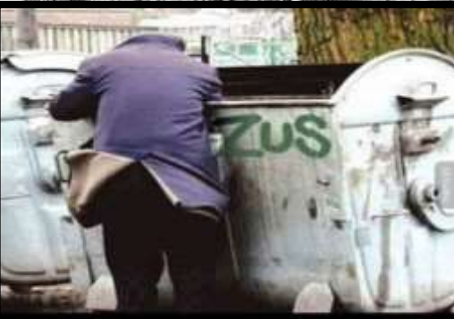
POBIERANIE ŚWIADCZENIA EMERYTALNEGO