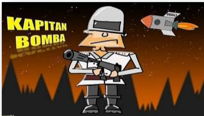
Kapitan Bomba, Reżyseria: Bartosz Walaszek